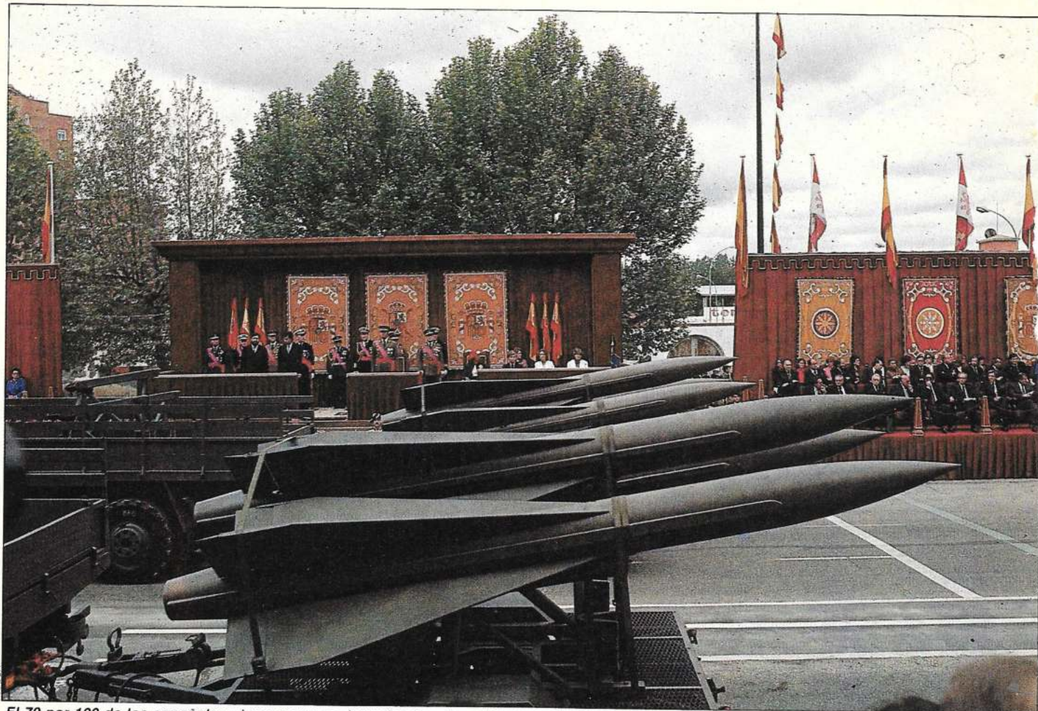
El 70 por 100 de los españoles piensan que no hay ningún valor o ideal que justifique una guerra.